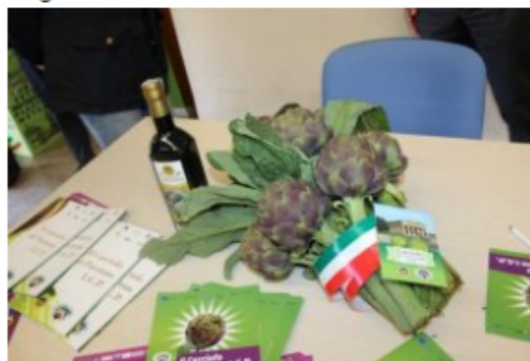
Parte la campagna promozionale 2018 del Carciofo di Paestum IGP