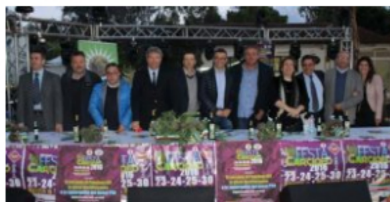
Ad aprile torna la Festa del Carciofo di Paestum IGP