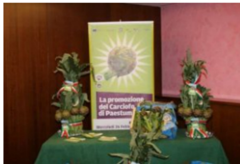
Al via sabato da Caserta la campagna 2017 del Carciofo di Paestum IGP