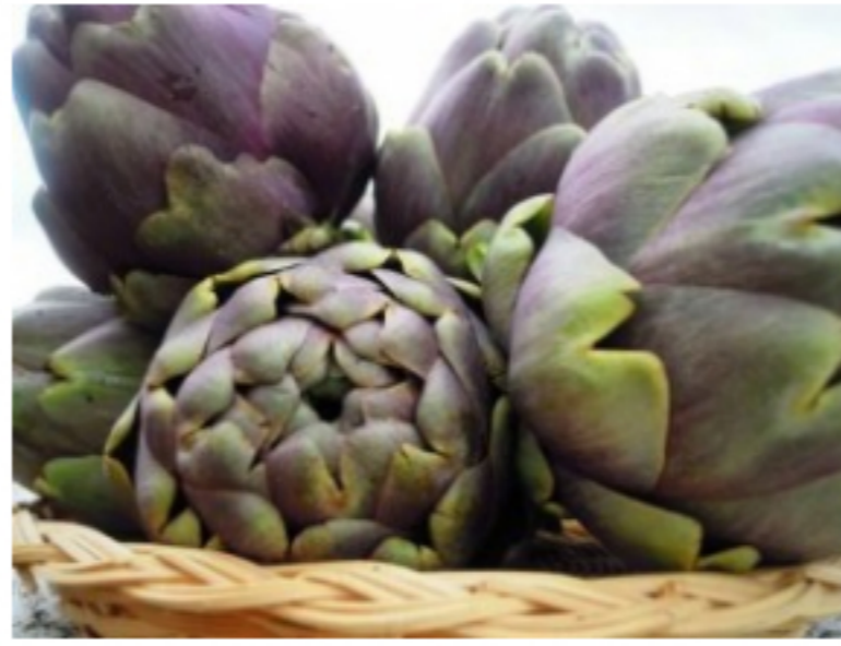
Il Carciofo di Paestum IGP in un percorso del gusto con chef stellato