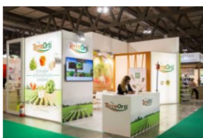
Terra Orti e il Carciofo di Paestum IGP al Fruit Logistica di Berlino