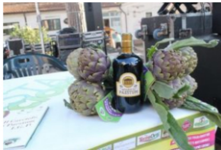
Riparte ad aprile la festa del Carciofo di Paestum IGP